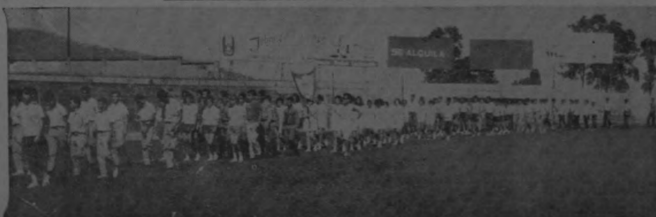
Esta panorámica está a la cabeza del desfile inaugural de los 17 colegios que participan en los Juegos Atléticos Intercolegiales. La ausencia de "barras" se hizo sentir. Falta el ruido y la alegría desahuciada.